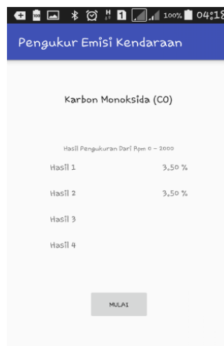
Gambar 6. Aplikasi Smartphone Android .

Tampilan hasil pengukuran emisi kendaraan pada smartphone Android dapat dilihat pada Gambar 6.