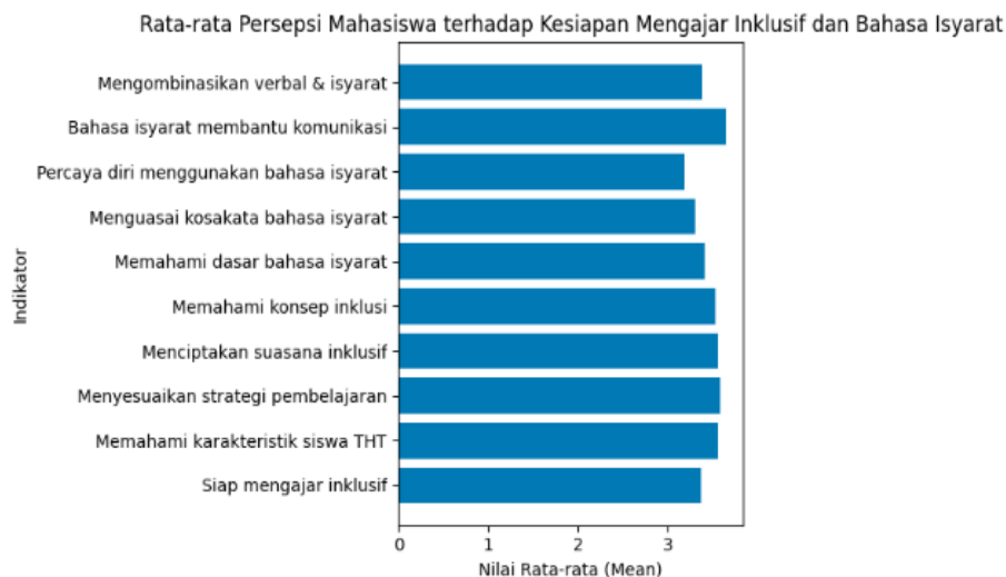
Gambar 1. Rata-rata persepsi mahasiswa terhadap kesiapan mengajar inklusif dan penggunaan bahasa isyarat