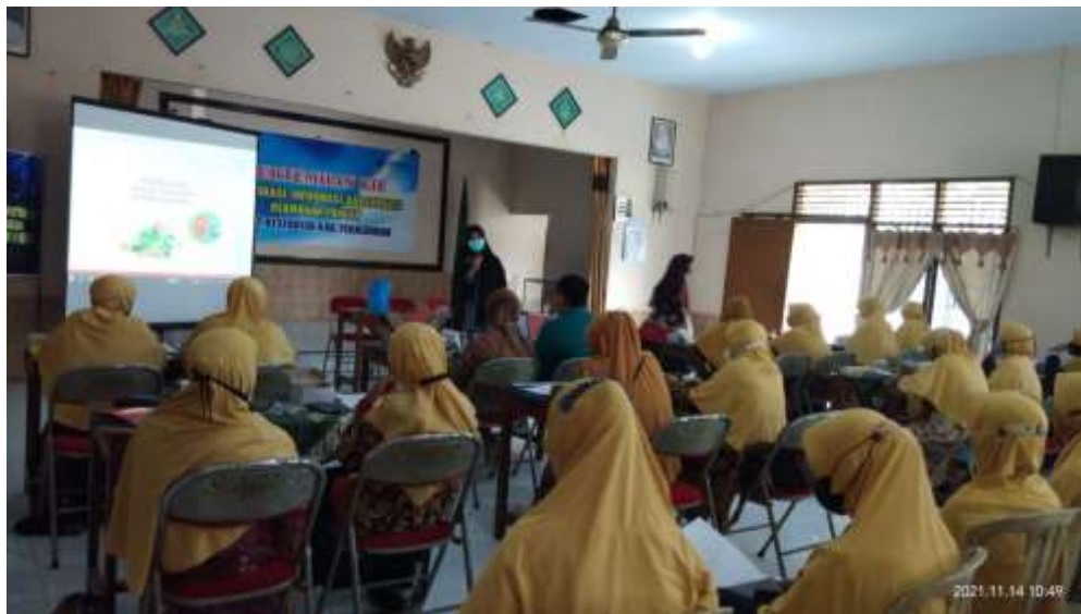
Gambar 1 Penyuluhan kesehatan tentang pengelolaan makan terkait resiko diabetes pada anak

Pada dasarnya kesehatan anak sangat dipengaruhi oleh genetik orang tua, faktor ini juga termasuk dengan pola makan orang tua. Pola makan orang tua juga turut mempengaruhi kondisi genetika dari anak. Asupan nutrisi yang masuk dapat mempengaruhi terjadinya perubahan DNA yang dapat diturunkan kepada anak atau cucu. Perubahan tersebut berupa perubahan lingkungan DNA, yang baru akan terlihat pada generasi kedua. Sebagai contoh, tidak terkontrolnya pola makan selama kehamilan seperti