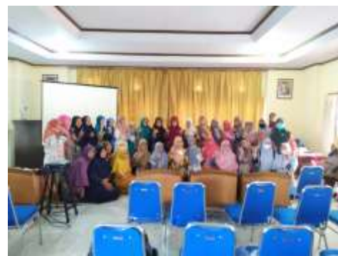
Gambar 4.2. Foto Kegiatan

Pendampingan pengelolaan keuangan ini dirasakan cukup penting mengingat TK/PAUD 'Aisyiyah akan bertransformasi menjadi lembaga pendidikan yang profesional sehingga dalam pengelolaannya perlu adanya keterbukaan, akuntabilitas dan juga pertanggungjawaban secara terperinci terhadap sumber dana dan penggunaan dana-dana. Selain itu memperkenalkan pengelolaan keuangan yang berbasis teknologi informasi (komputer) adalah dengan harapan pengelolaan keuangan dimasa depan menjadi lebih mudah dan baik oleh para pengurus maupun yayasan. Beberapa hasil yang dicapai dalam kegiatan pengabdian ini adalah sebagai berikut :