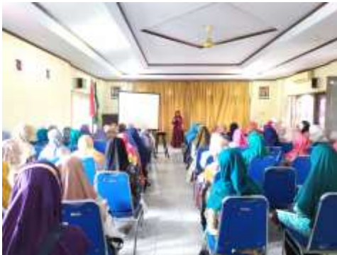
Gambar 4.1. Foto Kegiatan

Pelatihan ini dilaksanakan pada tanggal 17 Juli 2022 dari pukul 08.00 wib s.d 13.00 wib. Dengan susunan acara terdiri dari dua sesi yaitu sesi pertama berupa penyuluhan materi pentingnya laporan keuangan dan manajemen keuangan sekolah. Sesi kedua adalah pelatihan pembukuan dan laporan keuangan menggunakan Microsoft Excel. Di akhir pelatihan, dilakukan sesi tanya jawab mengenai isi materi penyuluhan dan pelatihan yang telah disampaikan. Selanjutnya sesi diskusi mengenai keberlanjutan program yaitu jadwal pendampingan pembukuan keuangan di masing-masing PAUD/TK 'Aisyiyah kota Pekalongan pada periode Oktober 2022. Dokumentasi (foto) kegiatan bisa disimak pada gambar 4.1 dan 4.2.