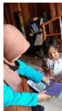
Gambar 4.7 Keberhasilan penelitian dalam peningkatan ketertarikan literasi pada anak

Menurut Enggelbetus (2016) dalam penelitiannya mengemukakan bahwa kemampuan literasi bukan hanya mengenai kemampuan membaca namun juga kemampuan menyimak, berbicara, dan menulis. Kemampuan literasi adalah landasan awal penguasaan ilmu pengetahuan, kemampuan awal dalam hal baca dan tulis. Cahyani (2015) mengatakan bahwa literasi awal bukan berarti diajarkan membaca langsung,