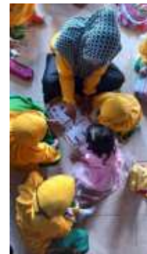
Gambar 4.5 Ketertarikan siswa ke buku maupun games puzzle di taman baca

Menurut Wasik & Carol, (2008) perkembangan literasi dimulai dari usia dini, walaupun perkembangan literasi pada setiap individu dapat berkembang seumur hidup. Gerakan literasi sekolah (GLS) merupakan salah satu usaha dalam peningkatan literasi di setiap jenjang pendidikan. Pengembangan literasi menjadi sangat penting untuk perkembangan kognitif anak dalam menunjang perkembangannya. Menurut Graves et al., (2011) taman kanak-kanak menjadi dasar dalam pengenalan literasi membaca. Keberhasilan dalam peningkatan literasi pada jenjang taman kanak-kanak yaitu pada model pembelajaran literasi anak dan perkembangan aspek kognitif siswa.