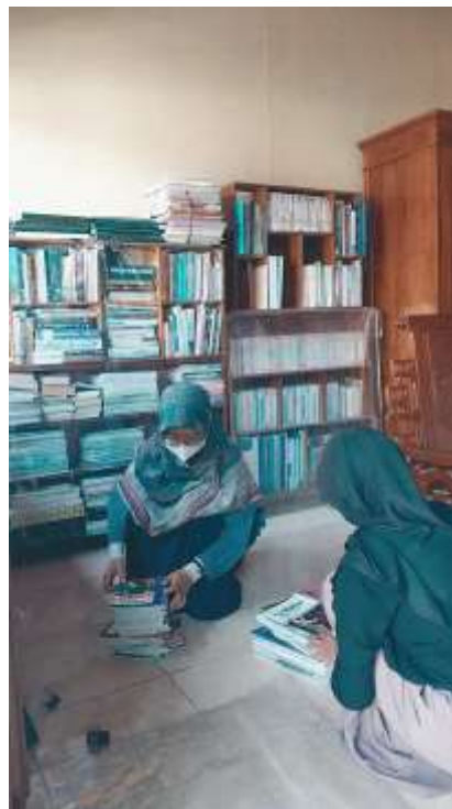
Gambar 3.1 Penataan buku di taman baca 20_11

Perpustakaan merupakan suatu program edukasi dalam unit kerja yang terdiri dari beberapa elemen yang saling berkaitan. Perpustakaan menjadi tempat kepustakaan atau tempat penyimpanan bahan pustaka dalam menunjang proses Pendidikan. Perpustakaan menyediakan berbagai referensi buku dari banyak kalangan yang memuat sumber belajar dan pusat informasi. Perpustakaan menjadi bagian penting dalam peningkatan literasi anak untuk mengembangkan minat baca dan sebagai media pengembangan anak (Riady, 2013). Menurut penelitian yang dilakukan oleh (Cahyani &