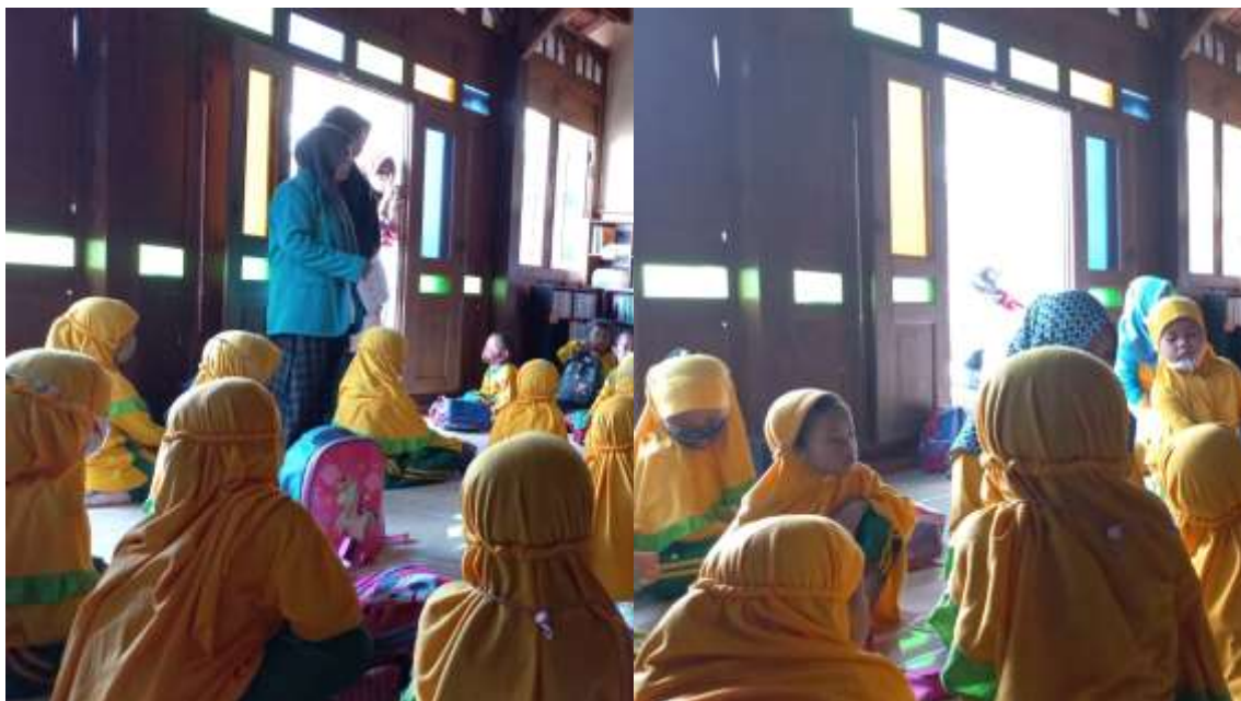
Gambar 3.4 Pengenalan taman baca ke anak TK

Taman kanak-kanak menjadi awal pengenalan literasi pada anak. Pemberdayaan guru TK menjadi sangat penting untuk dilakukan karena mereka menjadi media pengenalan siswa dalam peningkatan literasi sejak dini. Guru menjadi peranan penting sebagai mediator dan fasilitator siswa dalam dunia pendidikan. Guru menjadi orang terpercaya siswa dalam belajar sehingga peran guru dalam pengenalan taman baca maupun perpustakaan menjadi hal yang penting untuk dilakukan dalam peningkatan literasi anak (1).