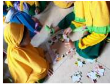
Gambar 4.6 Puzzle sebagai permainan motorik pada anak

Menurut Permendikbud Nomor 137 Tahun 2014, salah satu aspek yang harus dikembangkan dalam diri anak yaitu, aspek perkembangan kognitif, khususnya keterampilan pemecahan masalah. Mengembangkan kemampuan kognitif anak sangatlah penting, dikarenakan aspek perkembangan kognitif merupakan pondasi bagi kemampuan anak untuk berpikir, berkreaitivitas, dan berkarya. Menurut Dariyo dalam Safitri & Syukri, ( 2014) taman kanak-kanak memegang peranan penting dalam upaya pengembangan keterampilan berpikir kritis dan pemecahan masalah. Keterampilan dasar yang perlu diperkenalkan pada anak usia dini yaitu keterampilan memecahkan solusi. Kemampuan pemecahan masalah juga berpengaruh pada pengembangan logika matematika serta keterampilan untuk memilah-milah, mengklasifikasi serta keterampilan berpikir kritis anak.