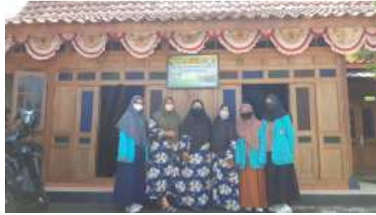
Gambar 3.3 Sosialisasi guru TK

Tidak hanya media dan metode yang bervariasi dan kreatif saja, tetapi peranan guru jauh lebih besar dalam meningkatkan minat membaca anak. Peranan tersebut dapat berupa kepedulian guru yang tinggi, pemanfaatan media yang baik dan kreatif serta komunikasi terhadap orang tua. Menurut penelitian dari Jackson menjelaskan bahwa peran yang lebih besar terhadap kemajuan anak-anak di sekolah ialah peranan dari struktur dan organisasi sekolah atau peranan dari guru. Dari hasil penelitiannya mendapatkan hasil bahwa guru memegang peranan penting, dimana perhatian dari guru dapat memajukan perkembangan anak (Jiwa, 2017).