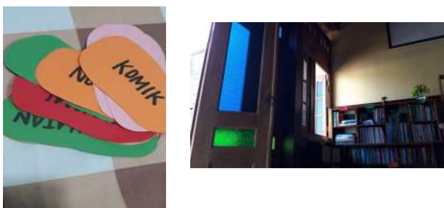
Gambar 3.2 Penamaan rak buku

Tim peneliti melakukan penataan buku sesuai dengan jenis buku dan tingkatan jenjang sekolah, penataan ini bertujuan untuk memudahkan pembaca untuk memilih buku yang akan dibaca dan mengorganisir buku agar mudah dijangkau. Penataan buku ini berdasarkan jenis buku, tingkatan buku bagi cerita anak diletakkan di bawah maupun tengah rak sedangkan untuk buku akademik diletakkan di bagian atas. Hal tersebut bertujuan untuk ketika anak mengambil buku dapat sesuai dengan tingkatan mereka dan tidak kesulitan dalam menjangkaunya.