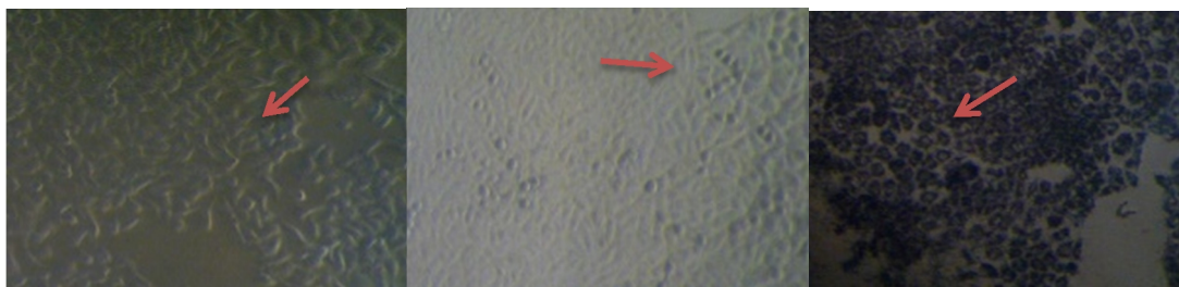
Gambar 1. Menunjukkan sel T47D hidup sebelum perlakuan (A), sesudah perlakuan dengan konsentrasi 125 µg/mL (B) dan terbentuknya kristal formazan pada perlakuan ekstrak etanol yang diberi MTT (C).

Pengamatan sel T47D dilakukan di bawah mikroskop dengan melihat perubahan morfologinya. Sel T47D akan berwarna gelap dan bentuknya sudah tidak beraturan dengan kepadatan yang lebih rendah, sedangkan sel yang hidup memiliki karakteristik lebih padat dan lebih terang (Djajanegara and Wahyudi, 2009). Perubahan morfologi sel T47D ditunjukkan pada gambar. 1b sel yang mengalami kematian berubah morfologinya dari yang bentuknya lonjong dan panjang (gambar 1a) menjadi bulat disertai titik hitam di tengah sel.