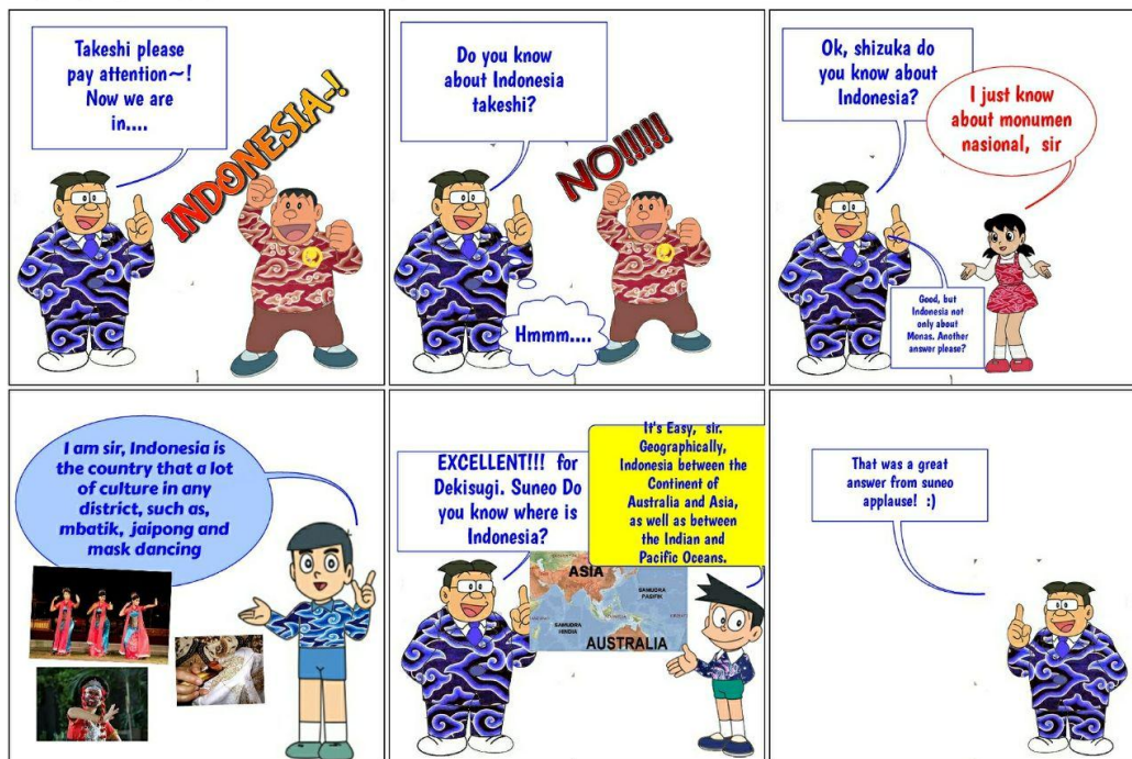
Gambar 5. What do you think of it?

Gambar No 5. Bertema What do you think of it? Pada teks buku aslinya merupakan percakapan yang berisi seseorang yang menanyakan apa yang dipikirkan seseorang , maka peneliti membuat situasi dimana Pak Guru bertanya kepada Takeshi dkk untuk menjelaskan hal apa yang mereka pikirkan saat berkunjung ke negara indonesia. Teks asli dari buku bahan ajar tersebut seperti berikut: