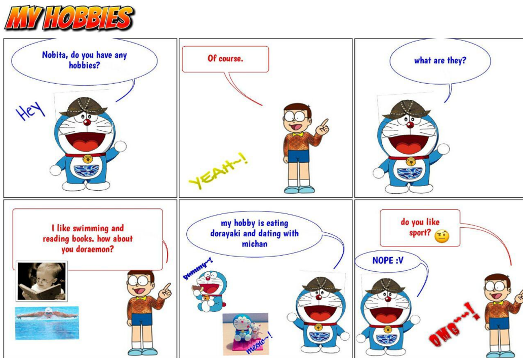
Gambar 3. (My Hobbies)

Gambar No 3. Bertema I Have a Lot of Hobbies Pada teks buku aslinya merupakan percakapan yang berisi seseorang yang menanyakan minat dan hobi, maka peneliti membuat situasi dimana Doraemon menanyakan minat dan hobi kepada Nobita untuk menjelaskan hal apa yang paling ia suka. Teks asli dari buku bahan ajar tersebut seperti berikut.