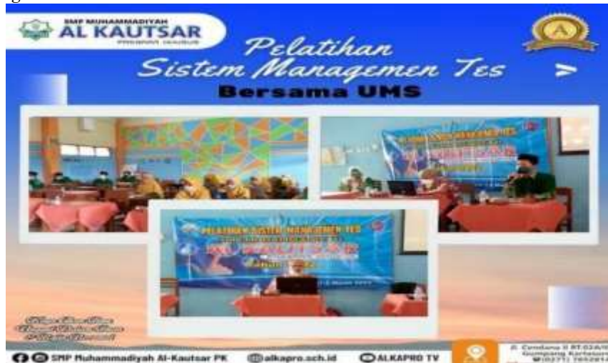
Gambar 1. Kegiatan pembukaan acara

Sebelum menampilkan hasil pelatihan, ijin penulis menampilkan 3 dokumen kegiatan sebagai berikut.