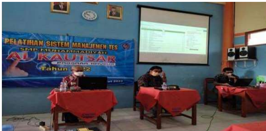
Gambar 2. Penyampaian materi