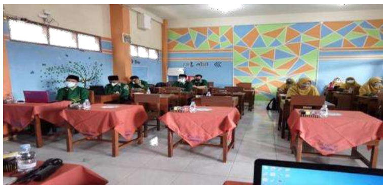
Gambar 3 . Mencoba sambil menyimak