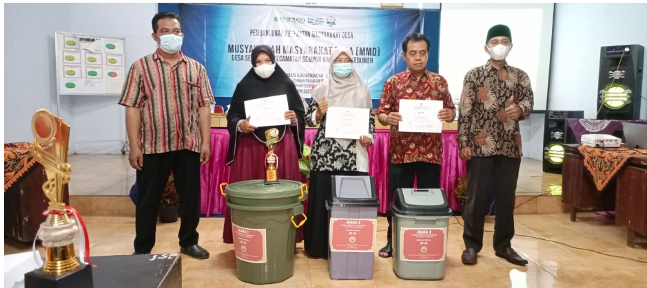
Gambar 3. Pemberian Hadiah Pemenang Lomba

Kegiatan sosialisasi tentang pengolahan sampah kepada warga desa Selokerto dilakukan pada tanggal 18 Januari 2022 bertempat di balai desa Desa Selokerto dan dihadiri oleh 30 orang yang terdiri dari ketua RW, RT, kadus dan kader. Materi Sosialisasi diberikan oleh petugas Kesling dari Puskesmas Sempor 1. Sebelum dan setelah dilakukan sosialisasi, dilakukan pre test dan post test pengetahuan warga tentang pengelolaan sampah.