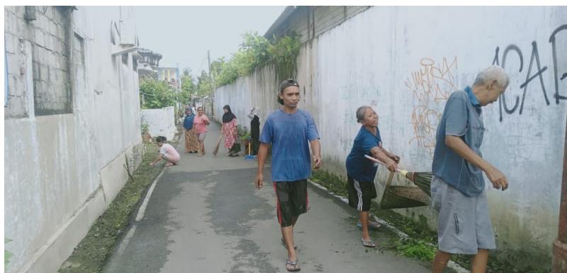
Gambar 2. Kerja Bakti dan Pemasangan Spanduk Kebersihan