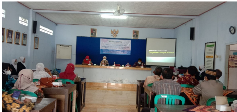
Gambar 1. Sosialisasi Pengolahan Sampah

Kegiatan pengabdian masyarakat ini terdiri dari beberapa kegiatan yaitu sosialisasi pengolahan sampah, pemasangan spanduk larangan membuang sampah, kerja bakti lingkungan dan pemilihan pemenang lomba kebersihan lingkungan. Kegiatan pengabdian masyarakat ini dilakukan selama 2 minggu dari tanggal 10 – 26 Januari 2022.